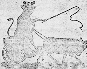
উদ্যান কাব্যিত্যিক হর্ষ ভুলব গাড়্যাবোহব।